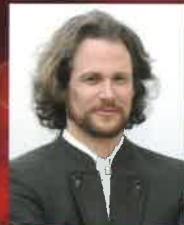
グレーテ・シュマルツバウアー (歌手/テノール)