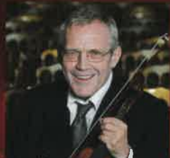
ウド・ツヴェルプアー (音楽芸術監督・コンサートマスター)