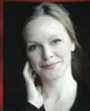
ヘーゲ・グスタヴァ・チョン (歌手/ソプラノ)