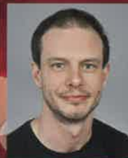
ドミニク・ビルクマイヤー (バレエ)