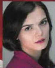
ズザーナ・フィクローヴァ (バレエ)