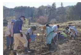
みんなで一列に並んで 苗を植えてきました

4万頭を飼育するには大量の葉を効率よく収穫する必要もあるため、植え付ける方向や肥料の量、株間などを念入りに計画したうえで植え付けを行っていきます。いつも何気なく作業をしている桑畑が計画をされつくされたものであることを改めて知ることができました。桑畑にもこれまでの先人の知恵が詰まっていると思うと、この営みをしっかり引き継いでいきたいなと感じますね。三沢区の近隣のみなさんのご理解と岡谷市内のみなさんのサポートがあるからこそ、こうして桑畑も養蚕も続いているのだと思いますが、今回植え付けた桑の苗には、今新たな芽が芽吹き、3年後には収穫ができるようになります。これからの成長がとても楽しみです。