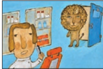
『バルバルさん』(福音館書店2003年)