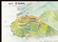
「宮坂武男 城郭鳥瞰図」 花岡城 長野県立歴史館所蔵

岡谷市にのこる4つの城跡(花岡城、高尾山城、小坂城、峰畑城)の歴史を、縄張り図や写真からひもときます。