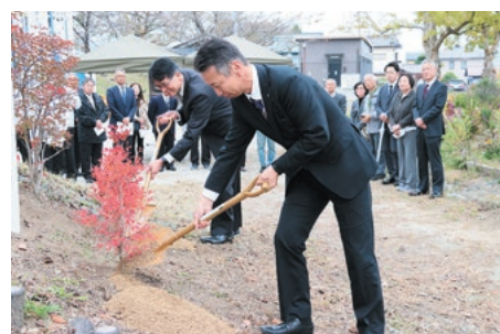
公共施設への市花・市木の記念植樹