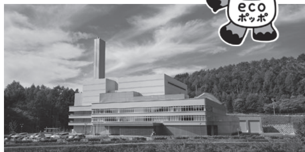
マスコットキャラクター えこぽん