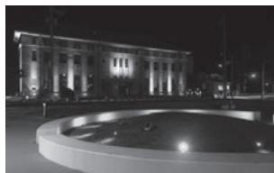
期間中は、環境月間のイメージカラー「緑」でライトアップ

事業所では、午後7時以降の照明を最小限に抑えるライトダウンをお願いします。ご家庭でも、ライトダウンを心掛けてください。