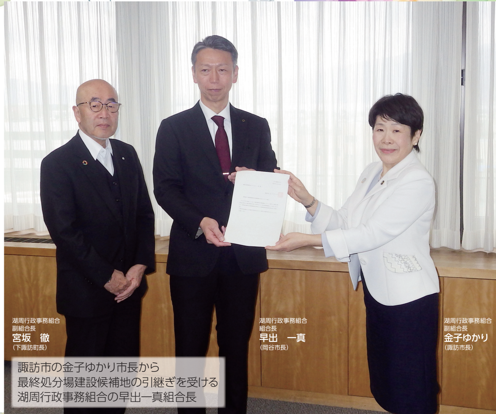
湖周行政事務組合副組合長 宮坂 徹 (下諏訪町長)