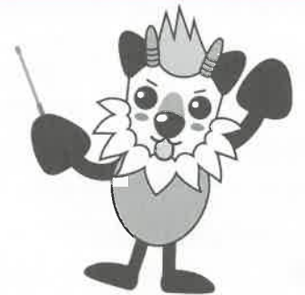
長野県消費者被害防止啓発キャラクター もシカっち