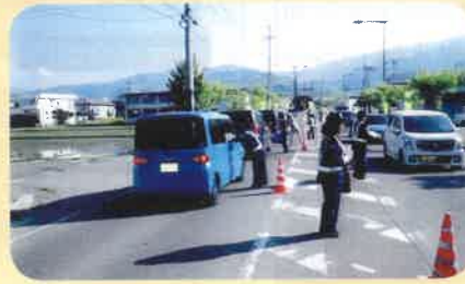
諏訪市内の市道上において交通指導所を開設し、通行車両にチラシを配布しながら安全運転を呼びかけた。(諏訪)