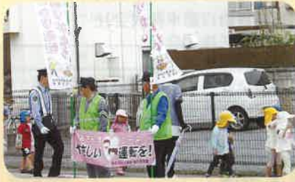
「子供を事故から守る」ための活動として保育園児の散歩コースの点検及び通行車両に対して園児への思いやり運転を呼びかけた。(佐久)