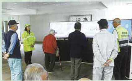
高齢者の交通安全教室において体験型の交通安全教育機器を活用し、高齢者の安全運転への意識を高めた。(川西)