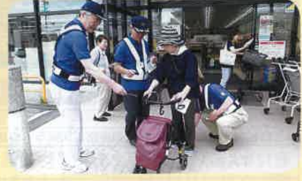
市内の商業施設において、買い物で訪れた高齢者に反射シールを配布し、夜間における反射材着用による交通安全を呼びかけた。(飯伊)