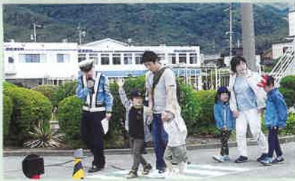
岡谷市内の園児と保護者の交通安全教室を開催し、正しい交通ルールと歩行中の事故防止を呼びかけた。(岡谷)

交通安全協会は、交通事故をなくすため、様々な活動を行っています。活動の一例を紹介します。