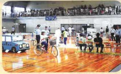
須高地区内では、各小学校から21チームが参加し、県大会を目指して子供自転車大会を開催した。(須高)