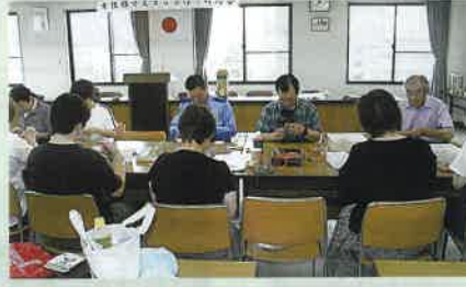
安全協会女性部は交通安全教室や交通安全運動等で配布するマスコットの作り方講習会を開催した。(安曇野)