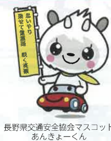
長野県交通安全協会マスコット あんきょーくん

評議員会では、平成30年度の事業報告、決算報告等について慎重な審議等が行われ承認されました。