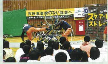
市内の高校において交通安全教室を開催し、スクエアストリートによる自転車事故の実演で自転車の正しい利用を呼びかけた。(上田)