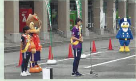
夏の交通安全運動に伴い、なでしこリーグ1部で活躍するAC長野パルセイロレディーズの選手2名も参加し街頭啓発活動を実施した。(長野南)