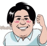
地域おこし協力隊 宮島

動画を撮ってしまいます。特に何かに使うわけでもないのですが、上手に撮れたりすると、少しばかり心が躍ります。