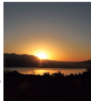
すてきな風景に出会えると得した気分になります (写真は朝の諏訪湖)

岡谷市は、四方八方いろいろな方向に出やすいすばらしい立地なので、毎週末のようにドライブをしてスマホのフォルダを圧迫する、そんな日々を過ごしています。すこし変わった趣味を見つけましたが、これもいろいろな場所に行きやすい岡谷に来たからかおれませぬ。