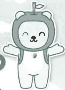
長野県PRキャラクター 「アルクマ」 ©長野県アルクマ