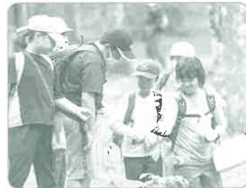
みどりの少年団交流集会