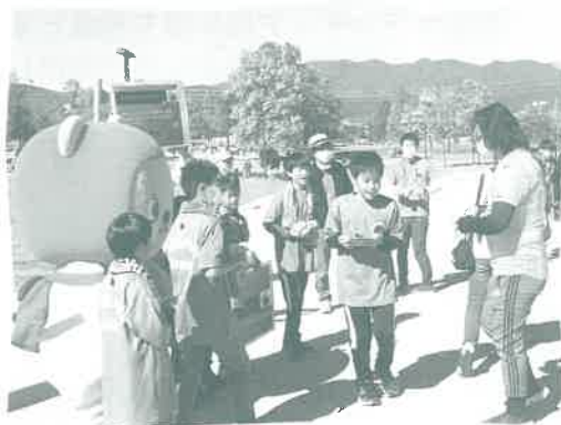
スポーツイベント会場での募金活動