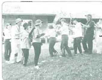
指導者スキルアップ研修会

各地区での身近な緑化活動や、 森林ボランティア団体等を対象とする公募事業、 みどりの少年団の育成などに活用しています。