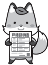
マスコットキャラクター コセキツネ

令和6年3月1日から本籍地以外の戸籍証明書などが取得できる、戸籍の広域交付が始まります。これにより、岡谷市に本籍がない人や、在籍した戸籍が全国各地にある人も、岡谷市役所の市民生活課の窓口で請求することができます。