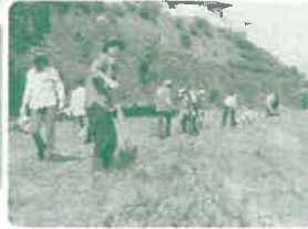
緑の募金公募事業