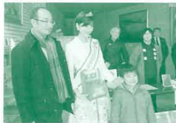
2017ミス日本みどりの 女神による募金活動