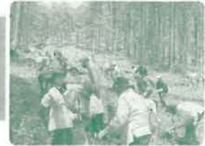
長野県植樹祭の開催