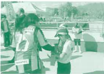
スポーツ団体募金