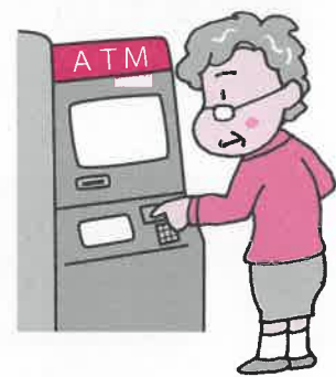
「ATMを操作」して戻る 還付金は絶対にありません！