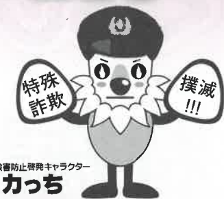
長野県消費生活センター もシカっち