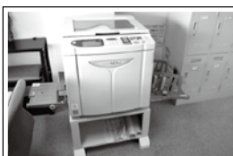
ボランティア団体・個人が利用できる印刷機