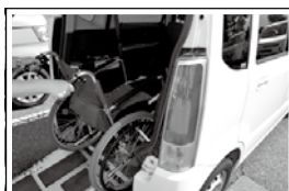
車いす移送車貸出