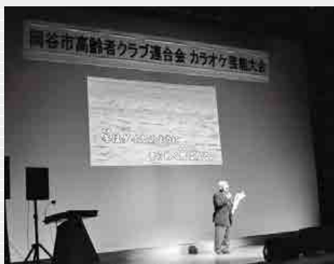
カラオケ芸能大会