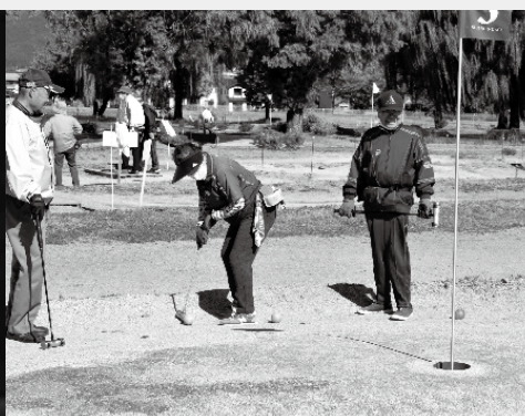
マレットゴルフ大会