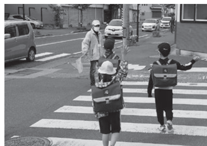
昨年の ふれあいたいむのようす

それぞれの学校・地域単位でさまざまな見守り活動が行われ、地域交流の場ともなっています。期間中は、より多くのみなさんで活動に参加し、地域で子どもたちの見守りの輪を広げていきましょう。