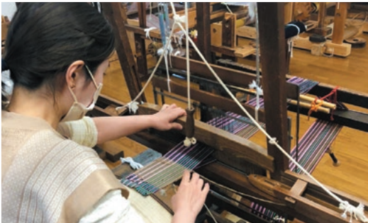
はらへりーずの昨年と今年の「よはくたび」より