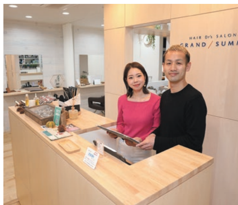
ナチュラルで明るい店内のようす

● 諏訪地域の中でも、岡谷市にしてよかった点は？ 大きなショッピングモールがあるので、生活に不便を感じないこと、人が集まる流れがあるところでしょうか。