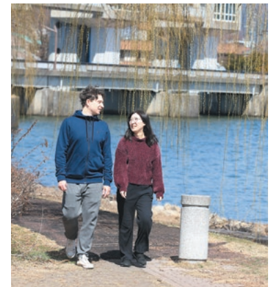
湖畔を散歩することも