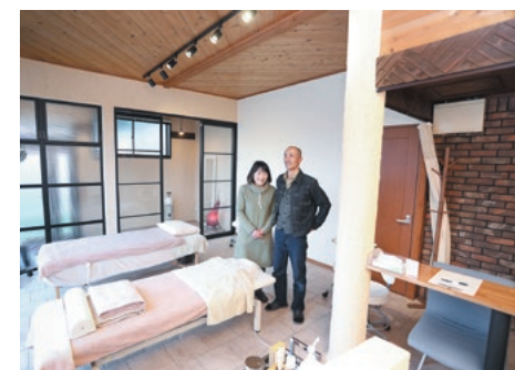
リラックスできる雰囲気店内

● 沖縄県から岡谷市に移住した理由は？ 沖縄では13年半暮らし、仕事も順調で不満はなかったんですが、旅行で諏訪湖の景色に出会い、「ここに住みたい！」と直感的に感じたのと、文化や歴史の風情がまちに残っているところに惹かれて、「新しい帰る場所」として岡谷市に住むことを決めました。