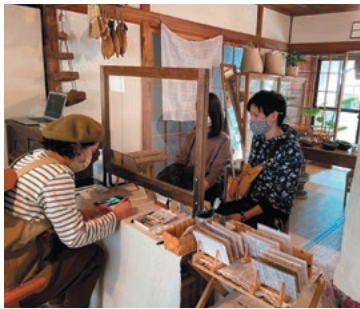
こんな感じで似顔絵を描いています

古くからある懐かしい雰囲気のご飯屋さんが好きでよく行きます。ずっと愛されてきた、間違いない感じがいいですね。