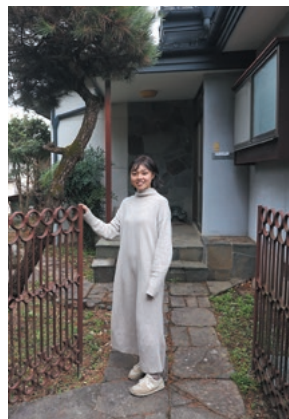
みもぎシェアハウスの玄関先で

● 岡谷市に暮らしての印象は？ 優しい人が多いと感じています。自動車の運転では道を譲ってくれたり、近所の方も「困ったことがあったら連絡して」と優しい声がけをしてくれ、人の温かさを感じています。