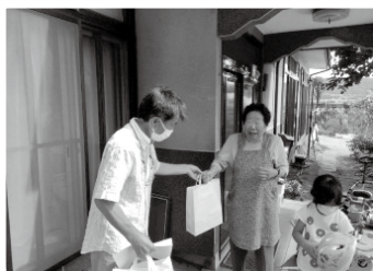
高齢者の見守り活動