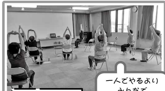
半年ぶりの 活動でした。

月に2回。1時間ほど体操やストレッチを行います。自宅ではなかなか運動ができない人もここではみんなで楽しく体を動かすことができます。 会の仲間も募集しています。市内在住の方はどなたでもご参加いただけます。