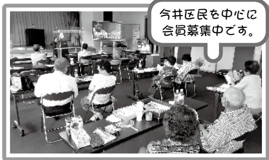
今井区民を中心 に会員募集中です。

6月から感染対策をして再開しています。 皆さんのこぶしがきいた歌声が響きます。 歌をきいている方も歌の間に拍手をはさみながら和やかな雰囲気を楽しそうに盛り上がっていました。