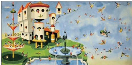
「こたりのくに」1956年 武井武雄