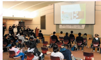
いじめ根絶子ども会議