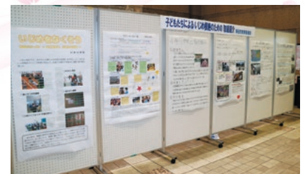
昨年の展示のようす