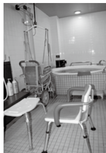
福祉風呂もあります。