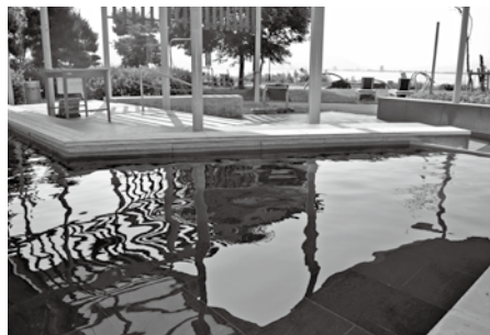
足湯は沢山の方が訪れます。