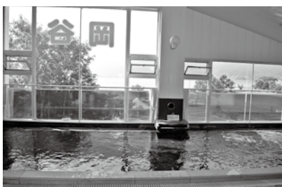
諏訪湖を眺められます。