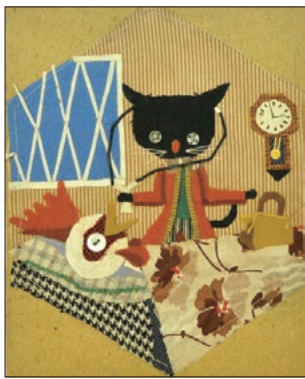
「ねこのおいしゃ」1957年 武井武雄

市民の皆様には、新型コロナウイルス感染症とインフルエンザの同時流行を避けるため、両方の接種を受けていただきたいと思っております。