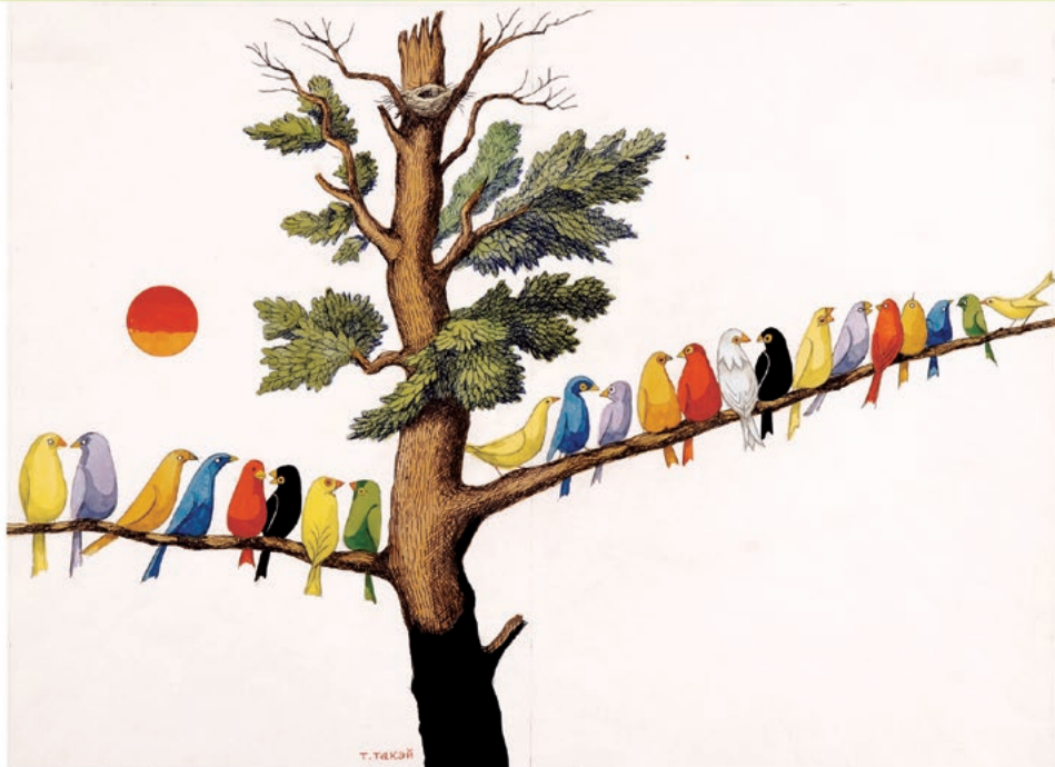
「ことりのしろちゃん」 武井武雄 1969年