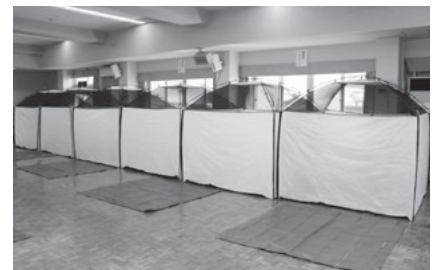
昨年度、小井川区での防災訓練の様子

また、市では、9月5日(日)に西堀区をモデル地区とし、コロナ禍における避難所開設・運営訓練を行い、有事の際の、ためらいのない避難につながるよう訓練に取り組みます。