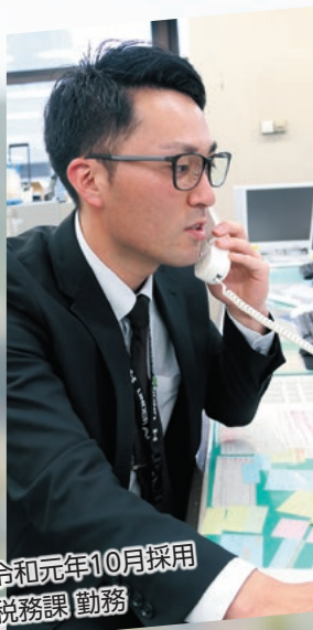
令和元年10月採用 税務課 勤務