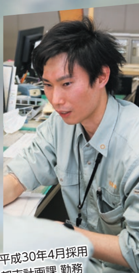
平成30年4月採用 都市計画課 勤務