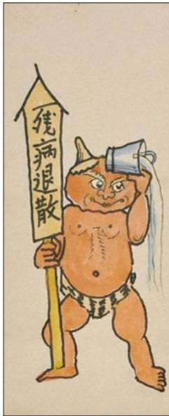
「残病退散」 制作年不詳 武井武雄

このワクチン接種は、多くの市民の皆様が期待を寄せ、関心の高い事業となることから、岡谷市医師会や岡谷市民病院などの関係機関と行政が一丸となつて、迅速かつ安全なワクチン接種に取り組んでまいります。