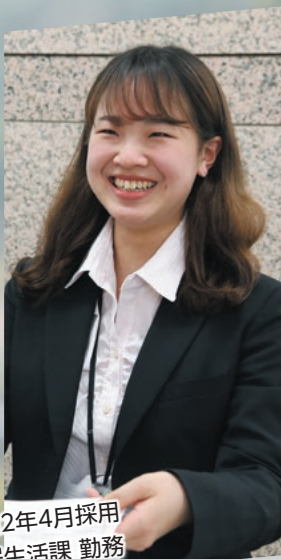
令和2年4月採用 市民生活課 勤務