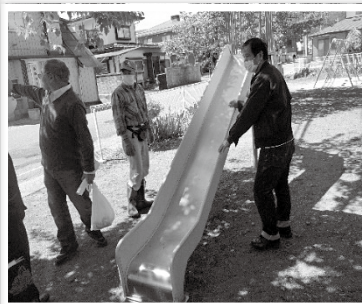
遊具の点検・補修作業の様子

コロナ禍の先の見えない状況の中でも、各地区の課題に応じて、どんな地域になったらいいかをみんなで考えながら活動しています。