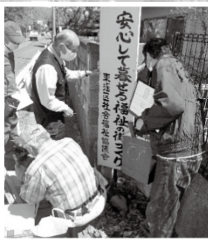
福祉看板の点検の様子