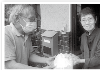
橋原地区社協の配食の様子

「コロナ禍で集まったの事業、会合や趣味等が中止となっている中で配食を実施して、皆さんと個々ではありますが話ができ、元気な姿を拝見し、喜んでいただくことが出来たのは大変良かったです。