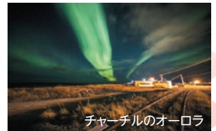
チャーチルのオーロラ