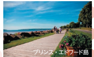
プリンス・エドワード島