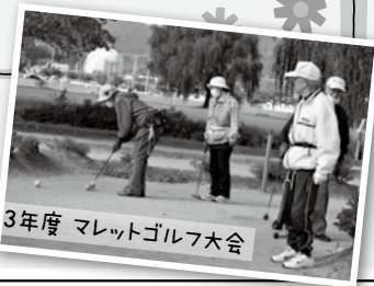
令和3年度 マレットゴルフ大会