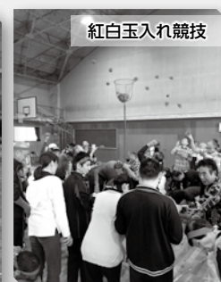
来賓も競技に参加