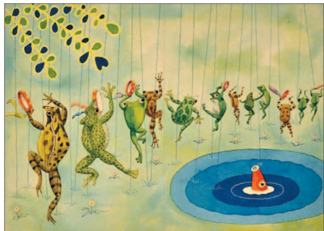
「ことり」1963年 武井武雄