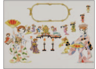
したきりすずめ 1970年 武井武雄

『桃太郎』や『舌切りすずめ』、『鴨とり権兵衛』など、数ある日本の昔話から、武井武雄が描いた作品をご紹介します。