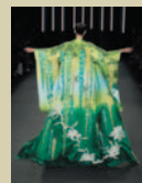
「ユミカツラ2018年秋冬パリオートクチュールコレクション」より

▶ユミカツラ・ファッションショー (長野県地域発元気づくり支援金活用事業) テーマ「日本のシルク文化とその魅力を世界へ!」