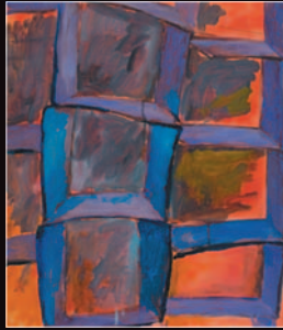
無題 制作年不詳 (2004-2005年ごろ)