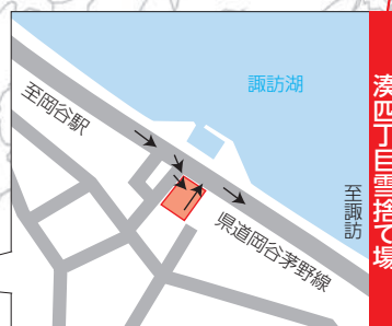
湊四丁目雪捨て場