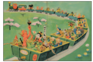
タイトル不詳 1955年 武井武雄

みなさんから寄せられた「あなたのお気に入りの武井武雄作品」を、その思いとともに展示します。