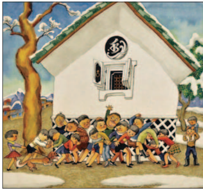
「こどものあそびカレンダー」1969年 武井武雄