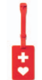
カバンにつけられるストラップ式

配布対象(共通) …障がいのある人など、周囲から助けが必要ときに利用したい人(障害者手帳などの有無は不問)。詳しくはお問い合わせください。