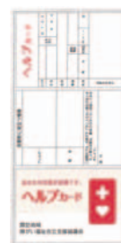
折りたたみ式のカードです