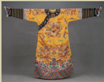
乾隆皇帝龍袍 清代(復元) ※前期展示

平成10年に岡谷市は中国の「蘇州絲綢博物館」と学術協定を締結し、同館が高い技術で復元した中国古代の絹織物などの提供を受けました。今回は初めて51点すべてを前後期に分けて一挙公開します。