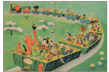
タイトル不詳 1955年 武井武雄

みなさんから寄せられた「あなた のお気に入りの武井武雄作品」を、 その思いとともに展示します。