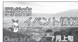
岡谷市イベント情報