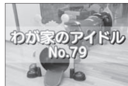
わが家のアイドル No.79