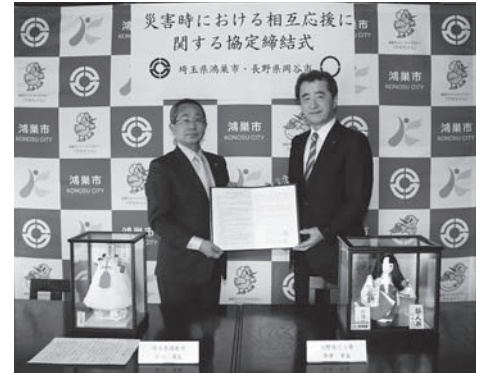
協定を取り交わす、鴻巣市 原口市長と今井市長