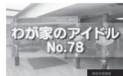
わが家のアイドル No.78

【特別番組】岡谷市民病院 市民公開講座 「世界が認めた名医が語る“肝切除と肝移植”」 (午前10時～・午後3時～・午後7時～)