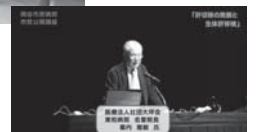
岡谷市民病院 市民公開講座 「世界が認めた名医が語る“肝切除と肝移植”」

視聴には、チャンネルの初期設定が必要です。設定方法がわからない場合は、LCV(☎0120-088-644)、または秘書広報課(内線1365)までお問い合わせください。出張による設定をご依頼の場合は有料となります。ご了承ください。