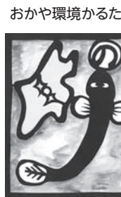
おかや環境かるた

環境問題に高い関心が示される一方で、灯油などの流出、違法な野焼き、不法投棄などが後を絶ちません。市民、