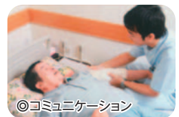
◎コミュニケーション