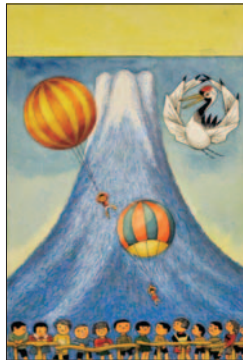
「ふじさん」1969年 武井武雄