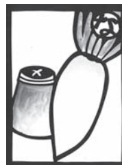
生ゴミは 土に還して 野菜肥え