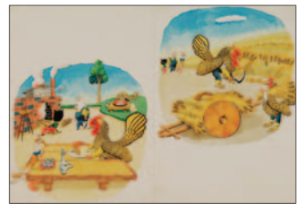
ひとつぶのむぎ 1960年

昭和2年に創刊された子どものための観察絵本『キンダーブック』に、執筆者・編集顧問として参加した武井武雄。空想の世界が広がる独特の世界観をご覧ください。