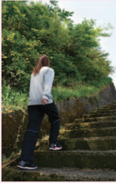
降旗餅店さんの横から急な石段を登ります

今回のスタートは釜口水門。総延長213キロ、全国第9位の長さを持つ天竜川の源流です。水門の管理事務所には「水の資料館」があるので、ちよつと立ち寄りたところですが、この先の花岡公園で、わたしを待っていてくれる人がいるので、今回は先を急ぎます。