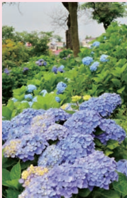
小坂観音院のあじさいも楽しみ

所要時間：約2時間 歩数：約5000歩 距離：約4km 消費カロリー：約200kcal