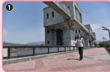
釜口水門遊歩道をスタート。左に諏訪湖、右に天竜川を見ながら進みます

な階段が続きますが、無理をせず、一段一段踏みしめて、ゆつくりと上りましょう。階段を上り切った広場で迎えてくれたのは、鷺湖城山泳鯉の会のみなさん。ゴールデンウィークになると、公園の上にたたく