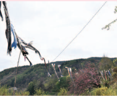
新緑に、元気に泳ぐこいのぼりたち。毎年ゴールデンウィークにはこんな風景が

な階段が続きますが、無理をせず、一段一段踏みしめて、ゆつくりと上りましょう。階段を上り切った広場で迎えてくれたのは、鷺湖城山泳鯉の会のみなさん。ゴールデンウィークになると、公園の上にたたく