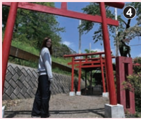
赤い鳥居が目を引く御辰宮。 なかにはかわいいお稲荷さんが