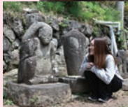
眼下に諏訪湖を見下ろす日吉神社でお参り。「みんなが元気に楽しく歩いてくれますように」