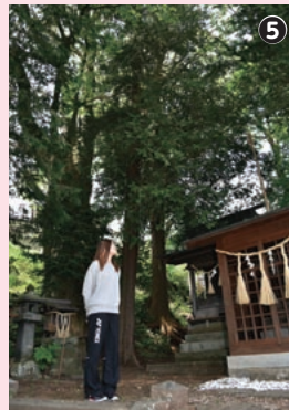
鉾持社の境内でひと休み。清らかな空気が汗ばんだ体に心地よい

ら、この先の小坂観音院まで足を伸ばし、あじさい祭りを楽しむのも素敵ですね。 きょうは、スタートから約2キロを過ぎたところで湖畔方向に下り、日