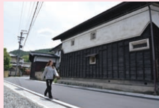
むかしの蔵があっという感じがですね

今回は終了です。みなさん、梅雨の時期でも晴れ間を見つけて、緑あふれる岡谷の道を歩いてください！ (取材日/5月12日)