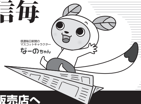
信濃毎日新聞の マスコットキャラクター なーのちゃん

購読のお申し込みは フリーダイヤル 0120-81-4341 又は 最寄りの信毎販売店へ