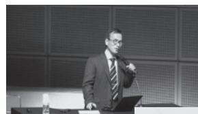
市民公開講座 「よくある眼の異常」