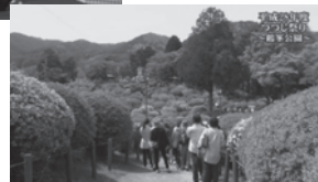
平成28年度 鶴峯公園つつじ祭り (再放送)

シルキーチャンネルはデジタルの11チャンネルで放送しています。視聴には、チャンネルの初期設定が必要です。設定方法がわからない場合は、LCV(☎0120-088-644)、または秘書広報課(内線1365)までお問い合わせください。出張による設定をご依頼の場合は有料となります。ご了承ください。