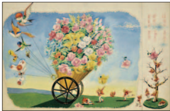
「はるがきた」1956年 武井武雄

また今年、JRグループなどが行う国内最大規模 の観光キャンペーン『信州グランドステーションキャンペ ーン』が7月から9月まで行われます。全国から多くの観 光客が長野県を訪れますので、このチャンスを活かして 岡谷市の魅力を発信し、多くの方に足を運んでいただ ければと思っています。