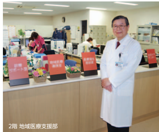
2階 地域医療支援部

支援部のなかには、在宅の介護や看護を支える「在宅ケアセンター」と、「地域医療支援課」があります。さらに、支援課のなかには、「地域医療連携」「医療福祉相談」「診療サポート」の担当があり、他の医療機関などとの連絡調整、患者さんの退院支援や医療を含めた生活全般の相談などを行っています。いずれも、患者さんに安心して医療を受けていただくための支援で、いまや岡谷市民病院にとって、なくてはならない大切な役割を果たしています。