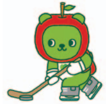
長野県PRキャラクター「アルマ」 ©長野県アルマ