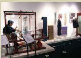
岡谷絹工房による機織り実演の様子

かつて岡谷で着られていた絹衣装の展示とともに、いま工場で作られている生糸が布になるまでの工程を追いながら、洋服地やインテリアとして利用されている現代の絹も紹介、未来へ向かう「絹のある生活」を展望します。