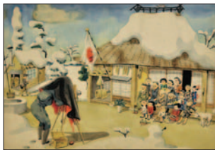
しやしん 1950年 武井武雄

早々11月に降雪があり、この冬は、寒い日が多いようにも感じています。インフルエンザの流行も早いようですので、ともに体調管理に十分気をつけて、寒さを乗り切りましょう。その寒さの中で、「ながの銀嶺国体」が、いよいよ1月27日から始まります。岡谷市は、軽井沢町とともにアイスホッケーの競技会場となっています。氷上の格闘技といわれるアイスホッケーの試合を、生で見られるまたとないチャンスです。迫力とスピード感をぜひ、地元で体感してください。冬季国体競技が、岡谷市で開催されるのは初めてのことでありますので、市民を挙げた応援、歓迎により、「ながの銀嶺国体」を一緒に盛り上げましょう!