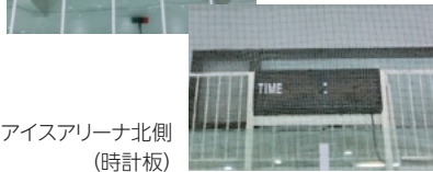
アイスアリーナ北側 (時計板)