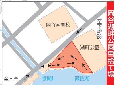
岡谷湖畔公園雪捨て場