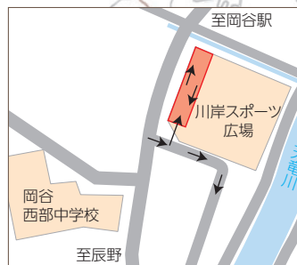
川岸スポーツ広場雪捨て場