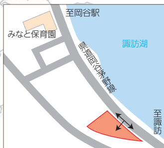
みなと保育園南側雪捨て場