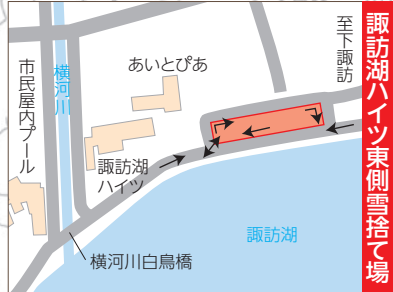
諏訪湖ハイツ東側雪捨て場