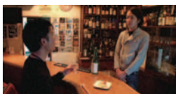
おかや de ショッピング