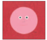
かおかおどんなかお 1988

企画展をご覧の人に“アンクルトリス トートバッグ”をプレゼント!(数に限りがあります)