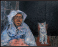
田中隆夫「農婦と猫」